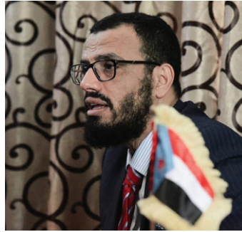
الأمناة / خاص : هدد المجلس الانتقالي الجنوبي بتحريك المقاومة الجنوبية بكل ثقلها إلى مدينة سيئون التابعة لمحافظة حضرموت، شرقي البلاد، التي من المقرر أن يتوافد إليها أعضاء مجلس النواب لعقد أولى جلساتها يوم السبت القادم . وكتب نائب رئيس المجلس الانتقالي الجنوبي، الشيخ هاني تغريدة على صفحته على موقع التدوينات المصغر، قال فيها: أي اعتداء على المتظاهرين السلميين من أبناء شعبنا في سيئون ستكون عواقبه وخيمة وستتحرر

وكان نائب رئيس المجلس الانتقالي الجنوبي هاني بن بريك، قد أعلن يوم أمس الأول على صفحته في تويتر ما وصفه بخبر سار للشعب الجنوبي . وقال بن بريك، في تغريدته : في هذه الأيام - بإذن الله - سنفرح بخبر سار لكل الجنوبيين . وأضاف "الخبر ما سترونه وتسمعونه، وليس سماعاً فقط" . واختتم تصريحه بالقول "اربطوا الأحزمة وكونوا جاهزين" ، دون أن يفصح عن أي تفاصيل أخرى .