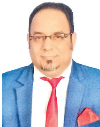
لتفعيل كلية المجتمع في محافظة مأرب ومحافظه المهرة و محافظة أبين . وأشار إلى أنه تم النقاش مع معالي

ونوه الحاج إلى أنه تم افتتاح أكثر من خمسة كليات مجتمع خاصة بمحافظة تعز بمنطقة التربة حازت على قبول وتسابق محموم من الشباب للألتحاق بهذه الكليات بما يخدم المستثمر والطالب والمجتمع والدولة . وأكد أن العمل يسير بوتيرة عالية