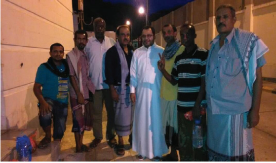
والمدنية الجنوبية.. شريطة اختيار أن يكون العضو فيها لديه شهادة ميلاد صادرة من عدن.