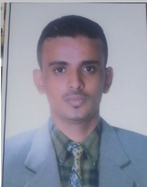
كاتب / أيوب العواجي

كل المنتسبين لهذي الوزارة ان يجدون ما افتقدوه منذ عقود مع المحولي ولا يسعني إلا أن نقول لهذا الرجل استمر في نشاطك وابداعك ولمساتك التي لم نلمس مثلها قط على مر التاريخ فهذه سطور متواضعة لم