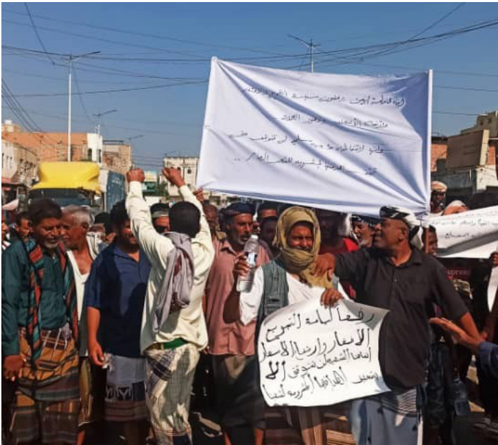
زنجبار - الأمناء - خاص :

شهدت مديرية زنجبار عاصمة محافظة أبين، أمس الاثنين، مظاهرات جماهيرية حاشدة تلبية لدعوة لجنة الاحتجاجات الشعبية لثورة الجياع بدلنا أبين للأسبوع الثالث احتجاجاً على تردي الأوضاع المعيشية والاقتصادية وارتفاع أسعار المواد الغذائية. ورفع المتظاهرون خلال المسيرة الجماهيرية التي انطلقت من أمام مبنى السلطة المحلية وجابت شوارع العاصمة زنجبار ، لافتات وشعارات تندد بارتفاع الأسعار وتدهور الخدمات الأساسية وتأخر صرف المرتبات، رافضين سياسة التجويع والافتقار. مطالبين مجلس القيادة الرئاسي والحكومة باتخاذ إجراءات عاجلة لمعالجة الوضع الصعب الذي يعانيه المواطنون. وبحسب رئاسة لجنة الاحتجاجات في دلنا أبين فان التصعيد مستمر حتى تحقيق مطالب المواطنين وإيجاد حلول عاجلة للوضع الكارثي في الجوانب الاقتصادية والخدمية.