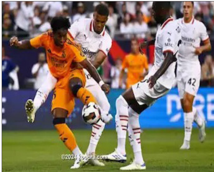
الأمناء / متابعات:

منذ الثالث من نوفمبر 2010، حين تعادل ريال مدريد (2-2) مع ميلان على ملعب سان سيرو، في الجولة الرابعة من دور مجموعات دوري أبطال أوروبا، لم يلتق الفريقان رسمياً في كلاسيكو أوروبا، الذي يجمع بين أكثر ناديين توجا بلقب الـ"تشانبيونز ليغ". وسيتواجه الفريقان، اليوم الثلاثاء على ملعب سانتياجو برنابيو، معقل حامل لقب الليجا. وأحرز ريال مدريد دوري الأبطال 15 مرة، مقابل 7 مرات لميلان. وإذا عدنا إلى الماضي، سنجد مباريات كثيرة جمعت الفريقين في دوري الأبطال، منها نهائي بروكسل 1958 الذي فاز به الفريق الملكي. وقد التقى الفريقان في دوري الأبطال 15 مرة، ففاز الريال في 6 منها، وانتهز في مثلها، وتعادل العملاقان في المباريات الثلاث المتبقية. وسجل الفريق الملكي على مدار هذه اللقاءات 24 هدفاً، في مرمى الروسونيري الذي هز شبك الميرنجي 25 مرة.