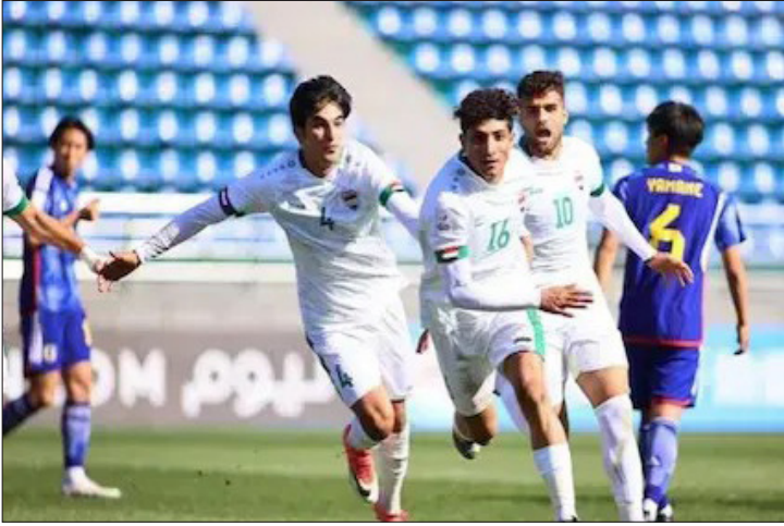
الأمناء / متابعات:

تسحب القرعة الرسمية لبطولة كأس آسيا للشباب تحت 20 عامًا 2025 في مدينة شينزين الصينية، الخميس المقبل. وتقام النسخة الـ42 من هذه البطولة خلال الفترة من 12 فبراير/ شباط، إلى الأول من مارس/ آذار 2025، وتضم منتخب الصين المضيف الذي تأهل تلقائياً، بالإضافة إلى 15 منتخباً تأهلوا للنهائيات من خلال التصفيات التي اختتمت الشهر الماضي. ومن بين الـ16 منتخباً المشاركين في البطولة، يسعى 12 منها للظفر بالكأس مرة أخرى، بما في ذلك كوريا الجنوبية، صاحبة الرقم القياسي بـ12 لقباً، والتي تأمل في الفوز بلقبها الـ13، والأول منذ عام 2012، إلى جانب أوزبكستان، حاملة لقب النسخة الماضية عام 2023 على أرضها. ويحجز أصحاب المراكز الأربعة الأولى في البطولة القارية مكانهم في نهائيات كأس العالم للشباب تحت 20 عامًا 2025 في تشيلي، حيث تسعى 3 منتخبات (تايلاند، قرغيزستان، اليمن) لتحقيق التأهل للبطولة العالمية للمرة الأولى.