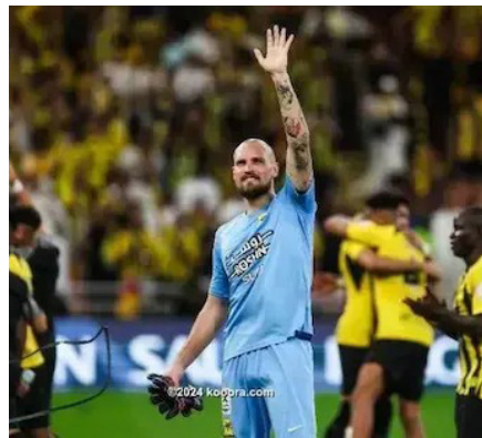
الأمناء / متابعات:

سيطر اتحاد جدة سيطرة كاملة على جوائز الأفضل في الدوري السعودي للمحترفين خلال أكتوبر الماضي. وأعلن الحساب الرسمي لدوري روشن عبر موقع التواصل الاجتماعي "إكس"، اختيار أفضل لاعب، وحارس مرمى، ومدرب، والشهر الماضي.