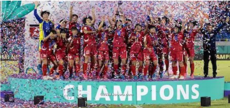
الأمناء / متابعات:

توجت كوريا الشمالية بكأس العالم للناشئات (تحت 17 عاماً)، الذي أقيم في جمهورية الدومينيكان، بعدما تغلبت على إسبانيا (4/3) بركلات الترجيح، بعد انتهاء الوقت الأصلي بالتعادل (1/1)، على استاد فيليكس سانثيز في سانتو دومينجو.