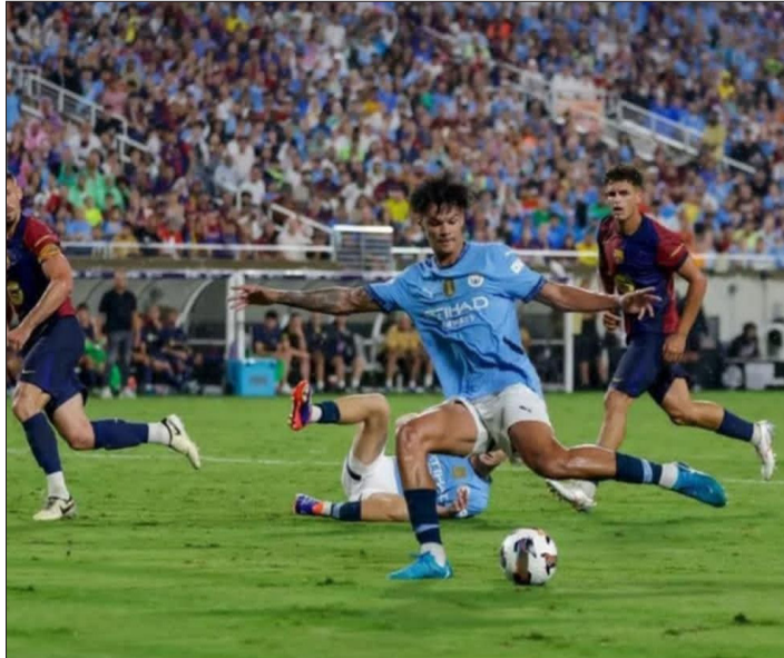
الأمناء / متابعات،

استهل برشلونة تحضيراته للموسم الجديد، بانتصار بركلات الترجيح على مانشستر سيتي، خلال مواجهة الفريقين الودية، على ملعب كامبج وورد في أورلاندو (فلوريدا) بالولايات المتحدة الأمريكية.