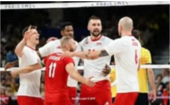
الأمناء / متابعات،

فاز منتخب بولندا لكرة الطائرة للرجال على نظيره البرازيلي 3 / 2 في المباراة التي جمعتهم أمس الأربعاء ضمن منافسات المجموعة الثانية بأولمبياد باريس 2024.