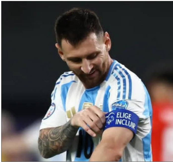
الأمناء / متابعات:

أظهرت الفحوصات الطبية التي خضع لها ليونيل ميسي نجم الأرجنتين، أمس الجمعة، التشخيص النهائي لإصابته. وكان الجهاز الفني للأرجنتين أعلن أن ميسي لن يلعب ضد بيرو بسبب الإصابة، ولم يؤكد أن اللاعب قادر على استكمال البطولة مع راقصي التانجو. ووفقا لصحيفة «موندو ديبورتيفو» الإسبانية، كشفت الفحوصات الطبية أن ميسي لا يعاني من تمزق في العضلة الضامة اليمنى، لكن لديه «تشنج». وأشارت إلى أن الجهاز الفني للأرجنتين سيجهز ميسي لمباراة ربع النهائي، لكن لا يجرؤ أحد في الأرجنتين على قول إن ليو سيتواجد بكامل لياقته في ذلك اليوم. وغاب ميسي عن مران الخميس الماضي، وسمح له الجهاز الفني بقيادة ليونيل سكالوني بالذهاب إلى عائلته، لا سيما أن منطقة الإصابة كانت منتفخة جدا. وأوضحت الصحيفة الإسبانية أن عدم وجود تمزق يعني أن ميسي سيعود إلى التدريبات خلال الأيام المقبلة. وكان منتخب الأرجنتين ضمن تأهله لدور ال16 بعد فوزين متتاليين أمام كندا بنتائبة دون رد في مباراة الافتتاح، ثم التغلب على تشيلي بهدف نظيف في الجولة الثانية.