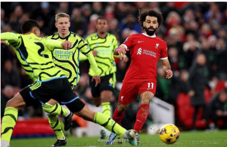
الأمناء / متابعات:

وأضاف: «الأمر لا يقتصر على عدم اتزان أوديجارد وسقوطه عن طريق الخطأ، إنه انزلق وأخرج ذراعه، وخلال سحب ذراعه مرة أخرى لمس الكرة باليد».