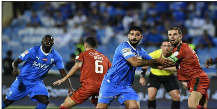
الأمناء / متابعات:

كشفت تقارير عن مفاجأة كبرى تخص قرب رحيل أحد الأسماء العالمية من دوري روشن السعودي للمحترفين. وكتب فابريزيو رومانو خبير الانتقالات، عبر حسابه بمنصة إكس: «من المقرر أن يسافر الإنجليزي جوردان هندرسون لاعب الاتفاق إلى أمستردام، قبل عطلة نهاية الأسبوع، لإكمال انتقاله لياكس، وتعمل جميع الأطراف على تسوية التفاصيل النهائية للعقد، اليوم».