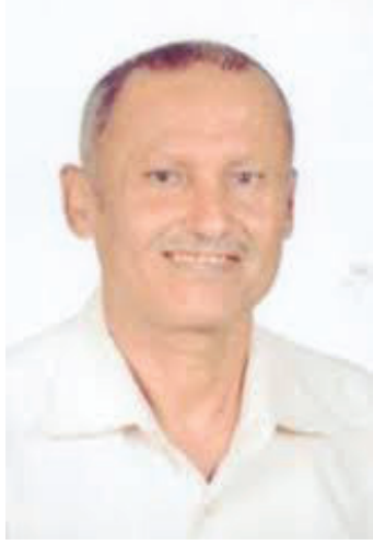
اليوم أكثر من أي وقت مضى، ولا

ولهذا نقول لإخواننا الذين يرغبون في فتح محلات للاتصالات الأرضية المحلية والدولية: لا خوف اليوم من انقطاع الكهرباء أو انعدام الوقود أو ارتفاع سعرها، فمنظومة الطاقة الشمسية اليوم هي البديل المناسب لكل ذلك، وعلى هذا الأساس ندعو عبر صحيفة "الأمناء" كل التجار ورجال المال والأعمال للعمل على فتح محلات لكابينات الاتصالات الأرضية والمحلية والدولية والفاكس خدمة للمواطن المغلوب على أمره، وهو بحاجة لها