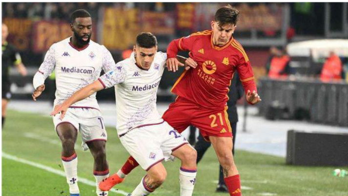
الأمناء / متابعات:

سقط روما في فخ التعادل الإيجابي 1-1 أمام ضيفه فيورنتينا في الجولة 15 من الدوري الإيطالي لكرة القدم.