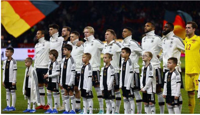
الأمناء / متابعات:

أعلن الاتحاد الألماني لكرة القدم، أن المنتخب الأول سيبدأ العام الجديد بمواجهة المنتخبين الفرنسي والهولندي في آذار/مارس المقبل استعداداً لخوض غمار بطولة أمم أوروبا (يورو 2024) التي تقام في ألمانيا.