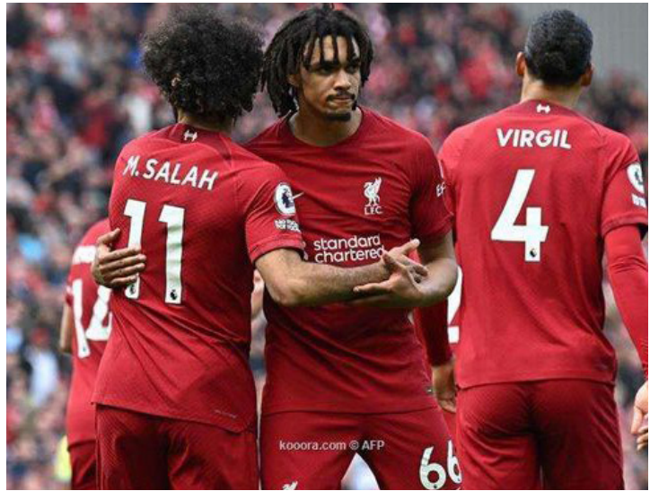
الأمناء / متابعات:

نجح لاعب ليفربول، من الموت المحقق إثر حادث وقع خلال تواجده في سيارته نتيجة هبوب رياح قوية أسفرت عن سقوط عمود كهرباء بطول 40 قدماً. ووفقاً لما ذكرته صحيفة «ذا صن»، فإن عمود كهرباء عالي الجهد، يزن حوالي نصف طن، سقط بمركمة كانت أمام سيارة ترينت ألكسندر أرنولد نجم الريدز. وضغط أرنولد (25 عاماً)، على المكابح بقوة وانحرف عن الطريق قبل أن يصطدم بسيارة أخرى، حيث شوهد نجم ليفربول وهو يخرج ويتحدث إلى السائق الآخر. ونجا كلاهما بأعجوبة دون أن يصابا في الحادث الذي وقع على طريق ريفي رطب، بالقرب من نوتسفورد بمدينة تشيشاير. وجاء ذلك في الوقت الذي تسببت فيه العاصفة «بابت» في حدوث فوضى في جميع أنحاء إنجلترا، ما أسفر عن مقتل 3 أشخاص. وقال مصدر للصحيفة: «كانت الرياح قوية للغاية، وكان الأمر مرعباً حقاً. إنها معجزة أن أحداً لم يصب بأذى. كان من الممكن أن يُقتل شخص ما بسهولة». وأضاف المصدر: «يشعر ألكسندر أرنولد وكأنه خدع الموت، بعد ثوانٍ قليلة كان من الممكن أن يخترق العمود الزجاج الأمامي لسيارته». وتظهر الصور ألكسندر أرنولد وهو يقف بجانب سيارته بالقرب من العمود الذي تدلت أسلاكه، قبل أن يحضر لاحقاً تدريبات ليفربول.