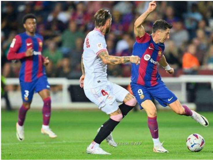
الأمناء / متابعات:

أرسلت رابطة الليجا، شكوى إلى الاتحاد الإسباني لكرة القدم ضد برشلونة، بعد صدور سلوكيات مسيئة من جمهور الفريق الكتالوني. ووفقاً لصحيفة «ماركا»، فإن جمهور برشلونة أطلق هتافات مسيئة ضد سيرجيو راموس مدافع إشبيلية، خلال مواجهة الفريقين في الليجا. ورصدت شكوى الليجا 4 هتافات مسيئة من جمهور برشلونة في الدقائق 16 و 18 و 76 و 89 من المباراة. وأشارت إلى أن الهتافين الأول والرابع تضمن كلمات مسيئة لنادي إشبيلية، صادرة من 500 شخص في الملعب ينتمون إلى البلوجرانا. بينما جاء الهتافان الثاني والثالث ضد سيرجيو راموس من نفس الجمهور، ويتضمن كلمات مهينة للاعب المخضرم وعائلته. يذكر أن المباراة انتهت بفوز برشلونة بهدف دون رد، أحرزه سيرجيو راموس بالخطأ في مرماه.