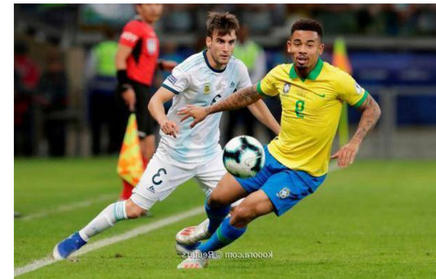
الأمناء / متابعات:

اختار الاتحاد البرازيلي لكرة القدم، ملعب مباراة منتخب السامبا ضد الأرجنتين، ضمن منافسات الجولة السادسة من التصفيات المؤهلة لكأس العالم 2026. وأكد الاتحاد البرازيلي، في بيان له أمس السبت، أن المباراة المقرر خوضها يوم 21 نوفمبر/ تشرين الثاني المقبل، ستقام على ملعب ماراكانا. ويتشارك منتخباً البرازيل والأرجنتين في قمة التصفيات اللاتينية برصيد 6 نقاط، بعد أن سجلا الفوز في أول جولتين.