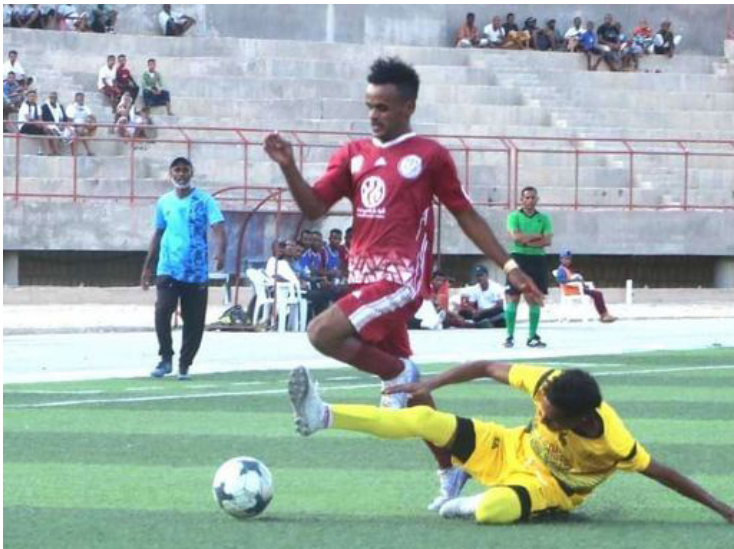
الأمناء / متابعات / علاء عياش :

تقاسم فريقا الريان والقادسية بساه نتيجة المباراة بنقطة لكل فريق بعد تعادلها سلبا في المباراة التي جمعتهم عصر أمس على أرضية استاد سيئون الأولمبي في الجولة الأخيرة للمجموعة الثانية، من بطولة دوري كأس الماهر الخامسة لكرة القدم لأندية وادي حضرموت التي ينظمها فرع الاتحاد اليمني لكرة القدم بحضرموت الوادي والصحراء بتمويل مجموعة الماهر التجارية.