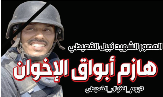
المصور الشهيد نبيل القحطبي