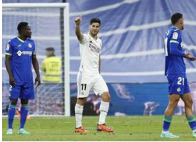
الأمناء / متابعات:

يسيطر الغموض على مستقبل ماركو أسينسيو نجم ريال مدريد، داخل قلعة سانتياجو برنابيو. وزعمت العديد من التقارير، أن أسينسيو قرر بشكل نهائي، عدم التجديد مع الميرنجي، وبدأ مفاوضات الانتقال إلى باريس سان جيرمان. وحسب صحيفة «ماركا»، فإن خوسيه أنجيل سانثيز المدير العام للميرنجي، عقد اجتماعاً أمس الجمعة، لمناقشة بقاء أسينسيو، ولم يتوصل لاتفاق بشأن تجديد عقد اللاعب. وأشارت الصحيفة إلى أن الأزمة بين أسينسيو وريال مدريد حول الجانب الرياضي وليس المالي، لأن اللاعب يشترط الحصول على دور أكبر في التشكيل الأساسي للميرنجي. ورغم ذلك، فإن قرار أسينسيو بعدم تجديد عقده مع ريال مدريد ليس نهائياً، وستكون كلمة الحسم في المفاوضات مع الميرنجي بعد أسبوع. لكن حتى الآن يسيطر التشاؤم على مفاوضات ماركو أسينسيو وريال مدريد بشأن الاستمرار معاً خلال الفترة المقبلة.