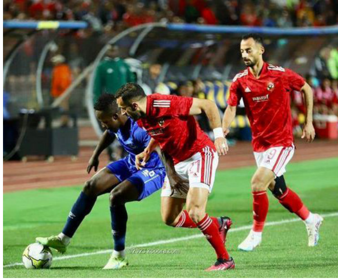
الأمناء / متابعات،

قررت لجنة الانضباط بالاتحاد الأفريقي لكرة القدم (كاف)، امس الأربعاء، توقيع عقوبة مالية مالية على الأهلي المصري، بسبب الشكوى التي تقدم بها الهلال السوداني ضده. وأقرت اللجنة غرامة مالية قدرها 120 ألف دولار أمريكي ضد الأهلي بسبب سوء تنظيم مباراته مع الهلال في دوري أبطال أفريقيا، وإلقاء جماهير الفريق المصري الزجاجات الفارغة تجاه لاعبي المنافس. وفاز الأهلي على الهلال بنتيجة 3-0 بستاند القاهرة في الجولة الأخيرة لمرحلة المجموعات بدوري أبطال أفريقيا يوم 1 أبريل/ نيسان الماضي. وأبلغت لجنة الانضباط، الكاف بالقرار، وتم إخطار الأهلي به بشكل رسمي. وأصدر الهلال بيانا رسميا أعلن خلاله رفضه ما تعرض له الفريق في تلك المباراة، كما اتهم النادي السوداني جماهير الأهلي بإطلاق هتافات عنصرية ضد لاعبيه.