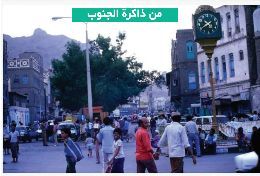
صورة نادرة لجولة ساعة الميدان (مقهاية زكو) عام 1986م وتحديداً قبل إزالة الساعة إبان العصر الذهبي.