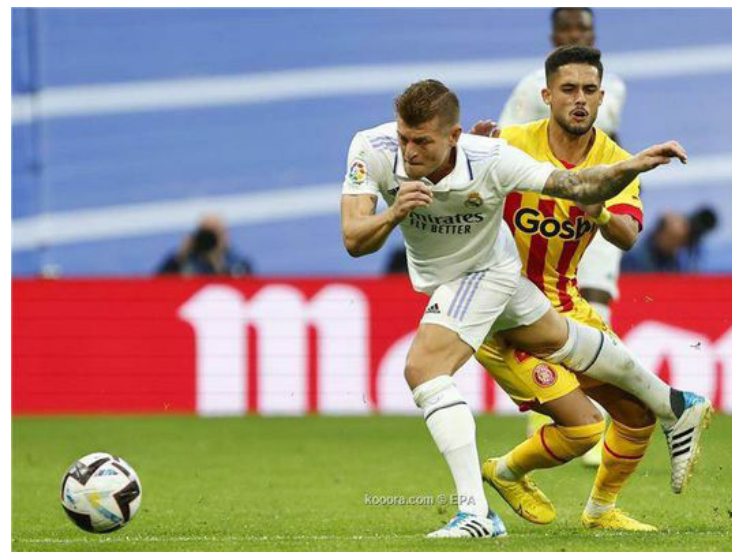
الأمناء / متابعات:

وأضافت الصحيفة أن كروس يدرس جيداً القرار، الذي ينوي الإعلان عنه بعد شهرين، والذي سيكون فارقاً في مسيرته. وكان المدرب كارلو أنشيلوتي، المدير الفني لريال مدريد، قد قال في نهاية أكتوبر/تشرين أول الماضي، عندما سُئل عن مستقبل كروس: «سيفكر في الأمر بعد كأس العالم، لكنني أعتقد أنه سيبقى». وكان كروس قد أعلن اعتزاله الدولي، في وقت سابق، من أجل قضاء فترات أكبر مع عائلته، والتركيز مع النادي الملكي.