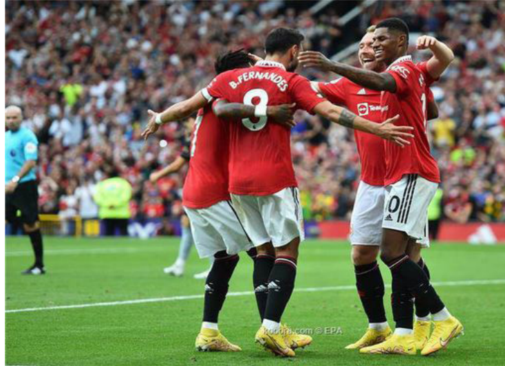
الأمناء / متابعات:

أعلن مانشستر يونايتد رسمياً، تمديد عقود رباعي الفريق ماركوس راشفورد ولوك شو وديوجو دالوت وفريد. ووفقاً للموقع الرسمي لمانشستر يونايتد، فقد قد فعلت إدارة النادي بنود التمديد لموسم إضافي في عقود اللاعبين الأربعة.