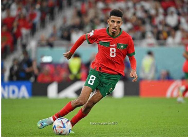
الأمناء / متابعات:

قدم نابولي عرضه الأول لأنجييه الفرنسي، من أجل التعاقد مع لاعب الوسط الدولي المغربي، عز الدين أوناهي، بحسب تقرير صحفي. وقدم أوناهي (22 عاماً) مستويات رائعة في مونديال 2022، حيث كان أحد أفراد كتيبة أسود الأطلس، التي حققت الإنجاز التاريخي باحتلال المركز الرابع. ووفقاً لجيانلوكا دي مارزيو، الصحفي الشهير في شبكة «سكاي سبورتس إيطاليا»، فإن أوناهي يعتبر أن اللعب في إيطاليا خلال هذه المرحلة، وتحديداً في نابولي، سيطور مستواه بشكل كبير. وأضاف دي مارزيو أن الباريتنوبي قدم عرضاً أولياً بالفعل لضم أوناهي، مقابل 25 مليون يورو. لكنه أشار إلى أن نابولي لا يحتاج أوناهي، في الوقت الحالي، نظراً لكثرة لاعبي الوسط في الفريق، إلا أن النادي الجنوبي يعتبره إضافة قوية للمستقبل. ويمنح هذا الأمر ميزة لنابولي في السباق على ضم نجم المغرب، لأنه سيرتبه على سبيل الإعارة لأنجييه حتى نهاية الموسم الحالي، في حال إتمام الصفقة هذا الشتاء.