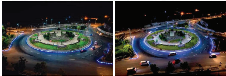
بهذه الحلة يظهر دوار العاقل بخورمكسر بعد استكمال تركيب "البردورات" المضيئة التي تدخل للعاصمة عدن لأول مرة كنوع جديد من أعمال الزينة وضمن جهود ومشاريع تحسين المدينة التي يقودها معالي وزير الدولة محافظ العاصمة عدن الأستاذ أحمد حامد للمس.