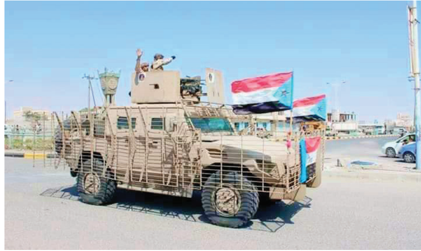
الحل الوحيد لنجاح المستقبل العربي هو إعلان الدولة الجنوبية كاملة السيادة ومنح العضوية الدائمة في الأمم المتحدة ضمن مجلس التعاون الخليجي.