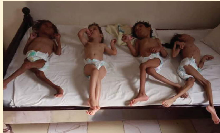
هؤلاء أطفال من مويح السرايا، مديرية الملاح، مرضى بسبب سوء التغذية وهم بالمشفى، وهناك الكثير من الحالات التي

يتوجب على وسائل الإعلام نقلها وإيضاحها حتى تتضح الصورة جلياً للجهات المعنية وعمل اللازم لهذه الحالات.