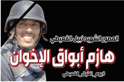
المصور الشهيد نبيل القطيبي