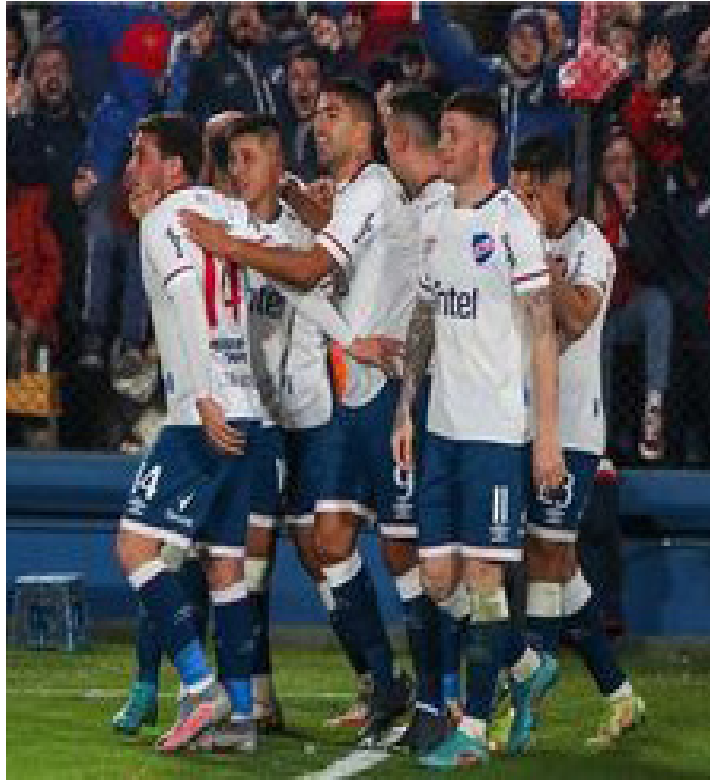
الأمناء / متابعات :

سجل الأوروغواي لويس سواريز أول أهدافه منذ عودته لفريقه ناسيونال، ليساهم في انتصاره بثلاثية نظيفة على رينتيستاس، ضمن الجولة الثانية من مرحلة إياب الدوري الأوروغواي لكرة القدم (كلاوسورا). وجاء هدف سواريز ليختتم ثلاثية فريقه في المباراة التي أقيمت مساء الجمعة بالتوقيت المحلي، وذلك في الدقيقة 59 من عمر اللقاء، الذي أهدر فيه لاعب برشلونة وأتلتيكو مدريد السابق ركلة جزاء في اللحظات الأخيرة من عمر المباراة.