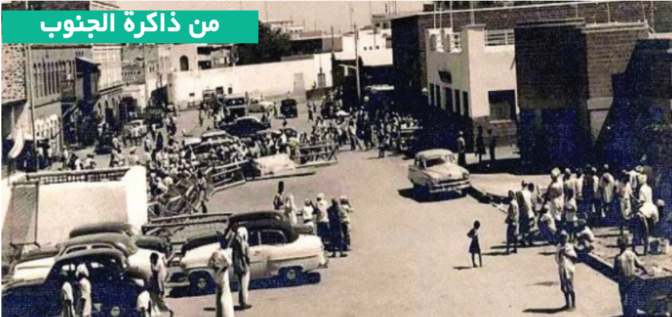
صورة نادرة لمدينة كريتر عدن قديماً في عهد الزمن الذهبي الجميل لتاريخ الجنوب.