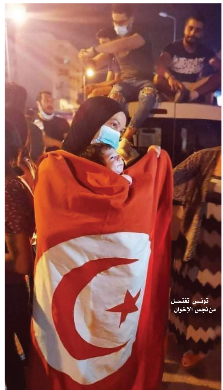
تونس تقتسل من نجس الإخوان

وهل سوف يأتي يوم ويمثل أمام العدالة ليلقي جزائه؟.. وللعلم هناك أناس حضروا الواقعة ولا زالوا احياء وهم على أتم الاستعداد للشهادة أمام القضاء..