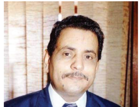
رجم الله صقر الجنوب الشهيد صالح أبو بكر بن حسيون