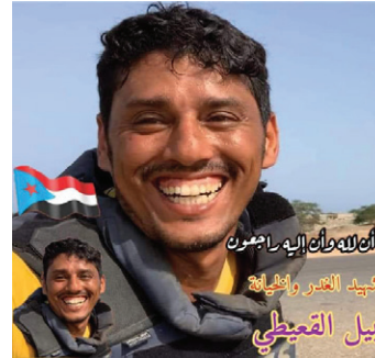
أهل الله ولاك إليه راغبون شيد الغدر وانفيلج نبيل التميمي