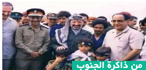
من ذاكرة الجنوب

وسيستمرون بتعذيبهم إن لم يتم التصدي لهم بإجراءات ومعالجات متكاملة فعالة وراعية؛ وبمسورة تتجاوز حدود ( الترفيع ) والجرعات المسكنة؛ فلم يعد لدى الناس مخزونا من ( الصبر ) يمكن الإعتماد عليه ولا قدرة لهم على التحمل بعد الآن؛ والوقت ينفذ ولم تعد بعيدة تلك اللحظة التي قد يتفجر فيها غضبهم ضد الكل ودون تمييز؛ وهو ما تتمناه تلك القوى المعادية للجنوب وقضية الوطنية؛ وتعمل بكل السبل المتاحة لها للوصول إلى حالة من الفوضى العارمة وتحديدا في العاصمة عدن؛ لأن بشاعة وقسوة معاناتهم قد وصلت إلى ذروتها؛ وأفقدتهم كل سبل التروي والتفكير المنطقي والنظر إلى أبعد من لحظتهم المعاشة التي يريدون وأقصى سرعة الخروج من دائرتها الجهنمية ولا شيء يهمهم أكثر من ذلك !!.