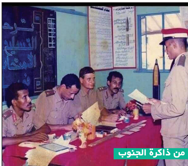
من ذاكرة الجنوب

وعبرت أسرة تحرير صحيفة وموقع "الأمناء" عن مشاطرتهم لكافة اقارب وذوي الفقيدة أجزانهم بهذا المصاب الجلل ساتلين المولى عز وجل أن يتغمدها بواسع الرحمة والمغفرة ويلهم أهلها وذويها الصبر والسلوان، إنا لله وإنا إليه راجعون.