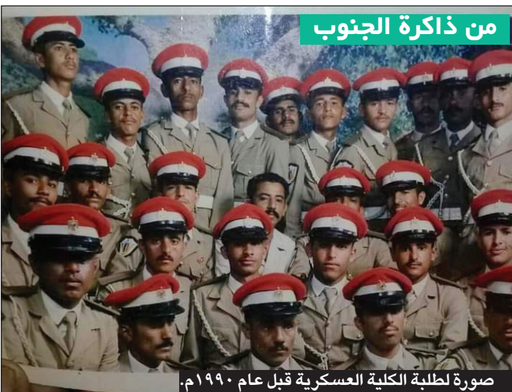
صورة لطلبة الكلية العسكرية قبل عام ١٩٩٠م.