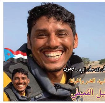
أبو نبل إلى اليمن شيد العسر والخيبة نبيل التميمي