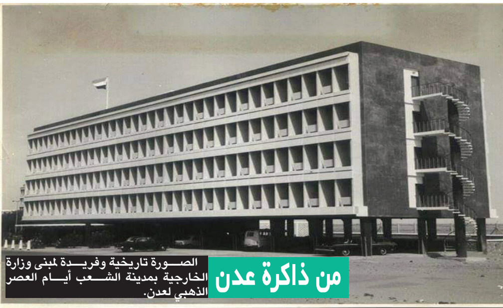
الصورة تاريخية وفريدة لمبنى وزارة الخارجية بمدينة الشعب أيام العصر الذهبي لعدن.

وشهد أيضاً مسيرة حافلة من الإنجازات النوعية التي تمكن من خلالها فريق العمل من تحويل التحديات إلى محطات نجاح تضاف إلى سجل حافل بالإنجازات سطره أبناء وبنات دولة الإمارات من الكوادر الوطنية الشابة العاملة بالمشروع بحروف