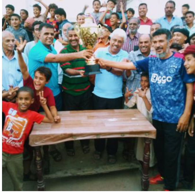
الأمناء / عدن / علاء عياش :

توج فريق الفتح بالتواهي بطلاً لمنافسات بطولة الفقيه إقبال السوداني «إداري نادي الميناء» لكرة القدم في فئة المخضرمين (40 سنة) وذلك بعد فوزه على منافسه فريق السري دار سعد بركلات الترجيح بعد انتهاء الوقت الأصلي للمباراة بالتعادل السلبي دون أهداف في المباراة النهائية للبطولة التي أقيمت على ملعب الفتح بالتواهي .