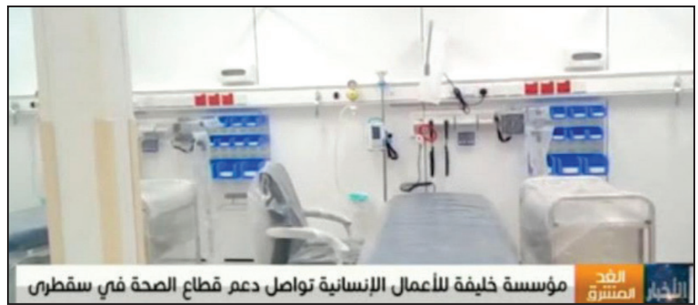
مؤسسة خليفة للأعمال الإنسانية تواصل دعم قطاع الصحة في سقطرى

وبحسب تقرير على قناة "الغد المشرق" فإن عملية التوسعة تسير وفق مسارين يتم معها استمرار استقبال المرضى وتجهيز غرف متعددة إضافية ومجهزة بأفضل الأجهزة الطبية. من جهتهم أكد مواطنو سقطرى أن مستشفى خليفة