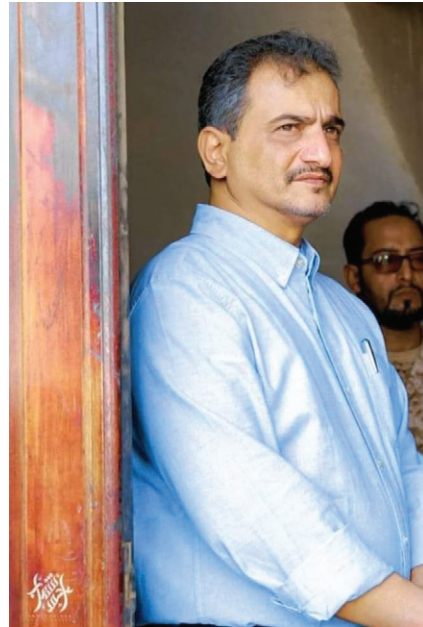
يا ابن شوبة وياربيب عدن الأصيل كن بخير ..

حكومة، كل تلك الأمور لم تعد خافية أو منكرة على أحد، إلا أنه يجب أن تدرك أنت كذلك يا أبا محمد أنك مصدر ثقة لأبناء عدن بشكل خاص وأبناء الجنوب بشكل عام ومحل إجماع من قبل الكل، ومثلما كنت جسورا في