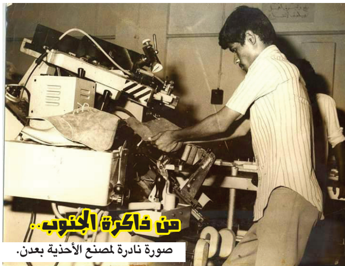
من ذاكرة الجنوب..