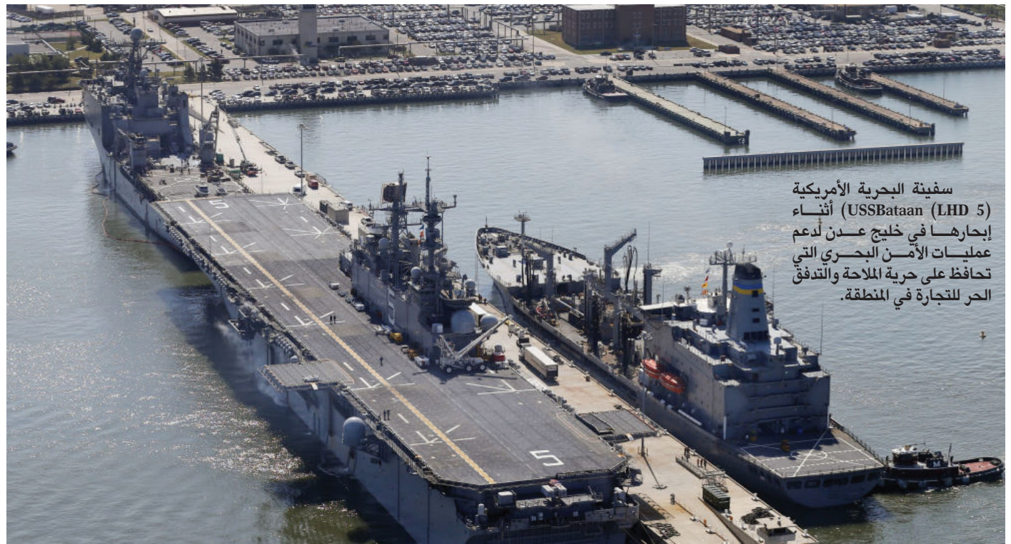
سفينة البحرية الأمريكية (USS Bataan LHD 5) أثناء إبحارها في خليج عدن لدعم عمليات الأمن البحري التي تحافظ على حرية الملاحة والتدفق الحر للتجارة في المنطقة.

من شوارع الشيخ عثمان "شارع اليرموك" المجاور لمبنى منتدى الفقيد محمد أحمد يابلي، ويقع ضمن هذا الشارع مسجد دغبوس. وجاء في عدد من سكان هذا الشارع، وهم من قرائي، فقالوا: "يا أستاذ، الأقربون أولى بالمعروف،