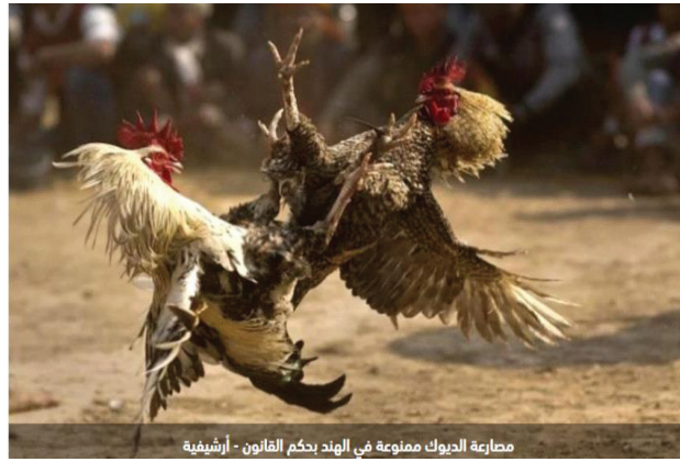
مصارعة الديوك ممنوعة في الهند بحكم القانون