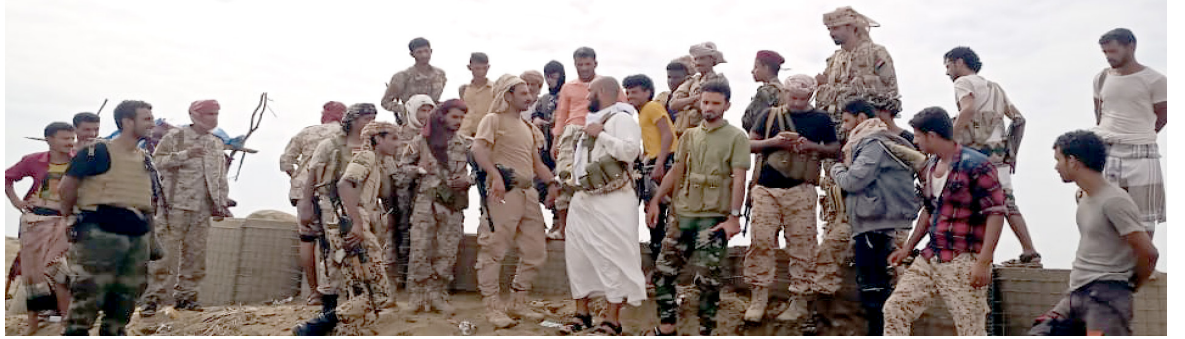
أبين / الأمناء / خاص :

وأدى أبطال القوات المسلحة الجنوبية ارتياحهم وتفؤلهم لهذه الزيارة التي رفعت معنويات الأبطال في الخطوط الأمامية وأجمع الأبطال على أن القوات الجنوبية في أعلى درجة من الاستعداد والتضحية والدفاع عن الأرض الجنوبية ضد المليشيات الإرهابية التي تريد اجتياح العاصمة عدن. وأكد الأبطال أن دماء الشهداء لن تذهب هدراً وأنهم سيستمرون في محاربة كل قوى التآمر والتدمير للجنوب والسعي لاقتلاع هذه المليشيات الغازية المتمركزة في قرن امكلاسي وشقرة. كما أكد الأبطال أن أرضنا لا تقبل الخوثة والمعتدين وأصحاب المشاريع المنقوصة التي تريد النيل من حق شعب الجنوب في تقرير مصيره ونيل حريته على كامل حدود ما قبل عام 1990م.